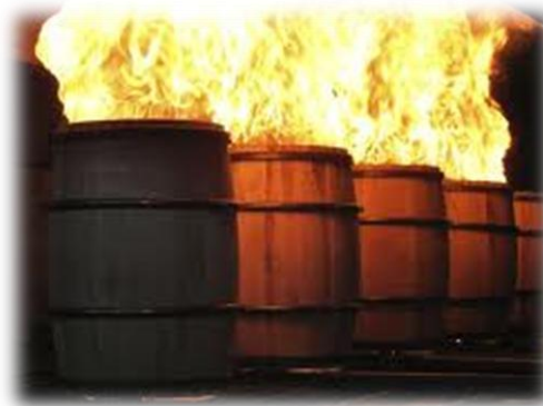
Eldas det upp whisky här? - Nej, för bövelen, här kolas faten!