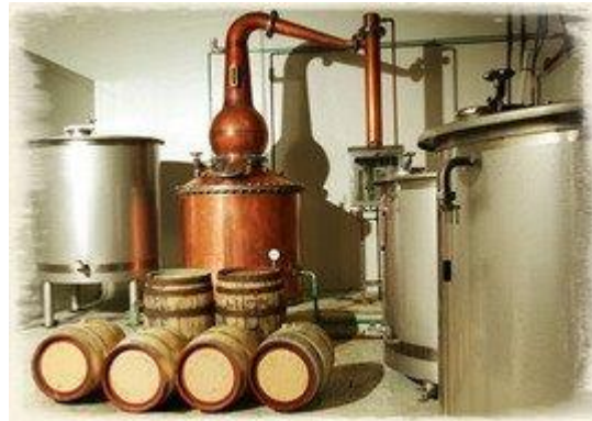
Sjyssta rat... pannor!