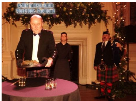
Det skulle kunna vara herr ordförande, iförd kilt, men det är hans kusin